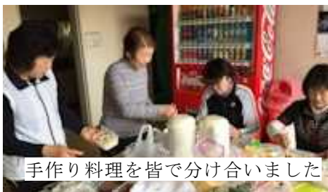
手作り料理を皆で分け合いました