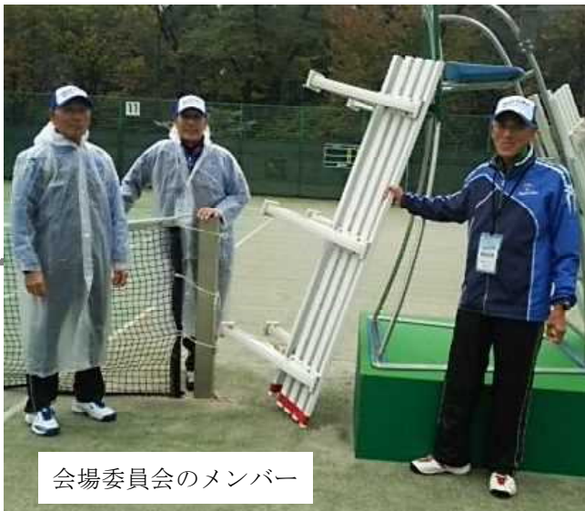
会場委員会のメンバー