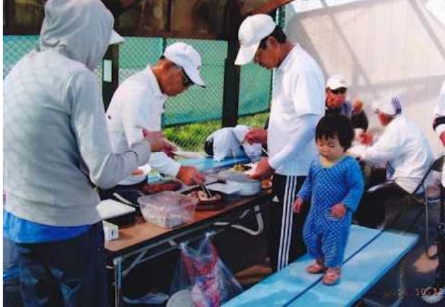
遠野の交流会では手作りの昼食やおやつが提供されました

遠野市、盛岡市、花巻市、大船渡市のロング会員(遠野市はロング以外の方も含む)が集まり、一戦毎にペ