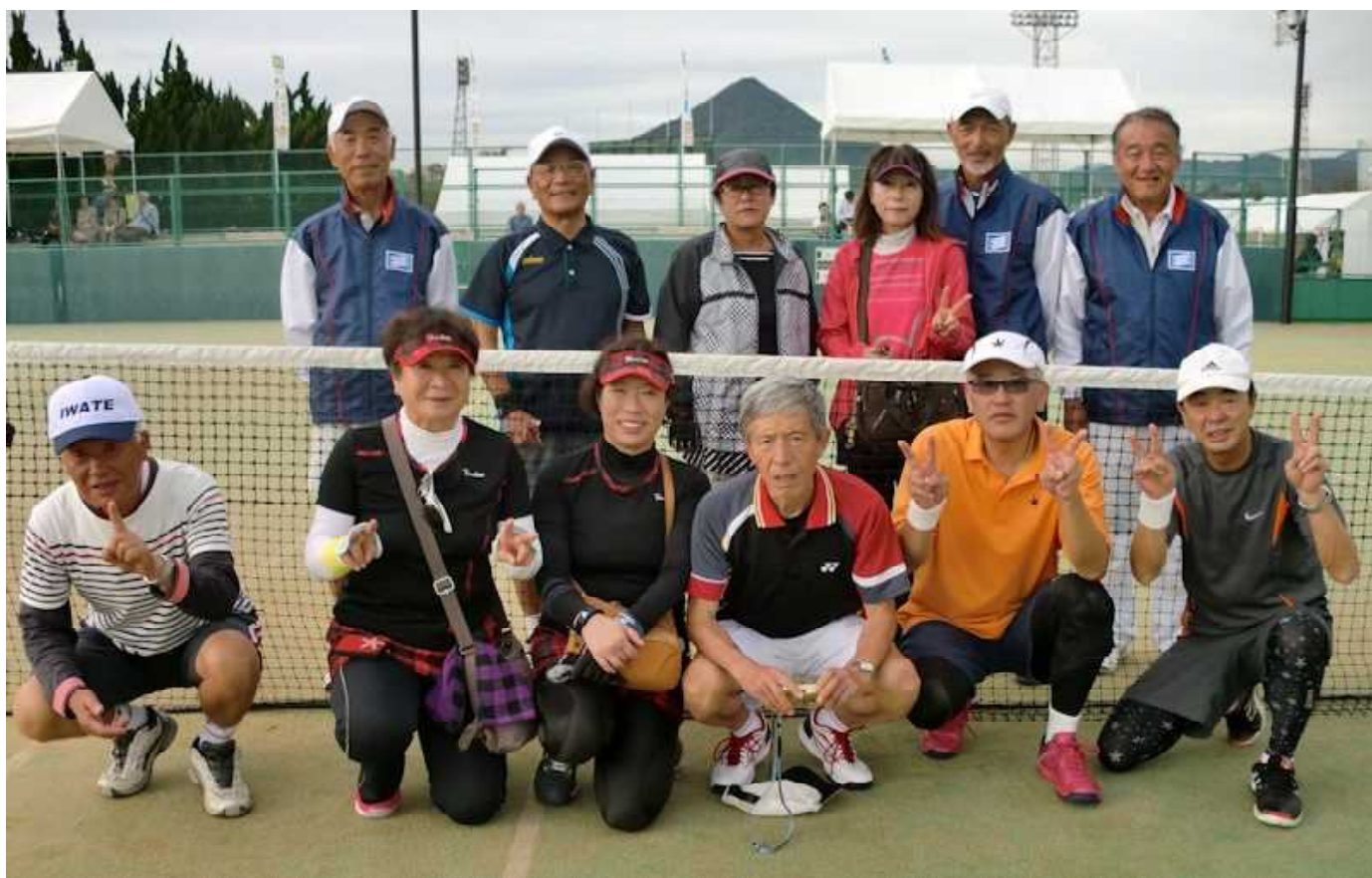
兵庫県チーム（後）との記念撮影。後ろに見える山は愛宕山（あたごさん）

最後になりますが、今回の大会参加にあたり、岩手県ロングテニスクラブからの御配慮と事務局への御手数をかけましたことを御礼申し上げます。