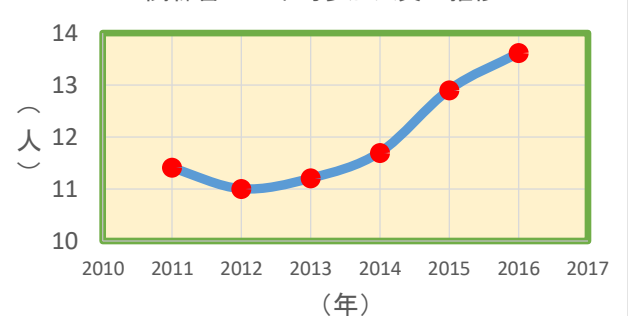
一関練習への平均参加人員の推移

・ 通常 4 ゲーム先取の試合が終わると組合わせ表により新しいペア及び相手を決め、それを数試合繰り返すと概ね全てのメンバーと平等にペアまたは対戦することになります一巡したら又皆でジャンケンして組合わせを変えます。