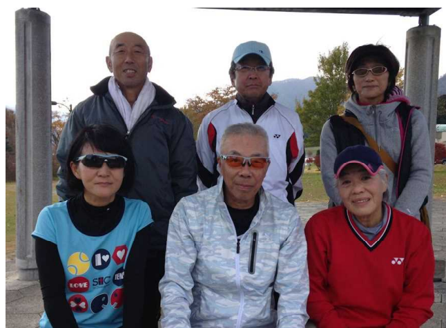
地元紫波町の皆さん+ロング会員の方もいます。皆さん酒豪です