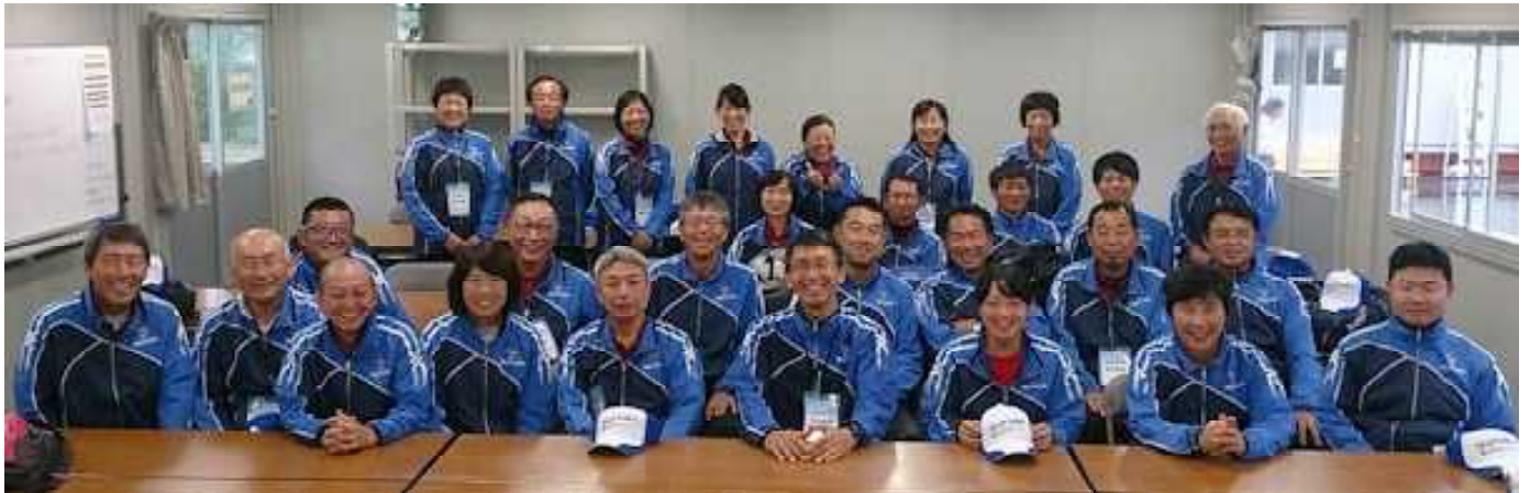
国体2日目のSCUメンバー、1日をなんとか乗り切り皆良い顔をしています。

ざいました。45年に一回開催される国体に4年間関わる事ができ県内テニス界の沢山の方々と出会うことが出来た。「スポーツは素晴らしい」、最後はこの一言につきます。