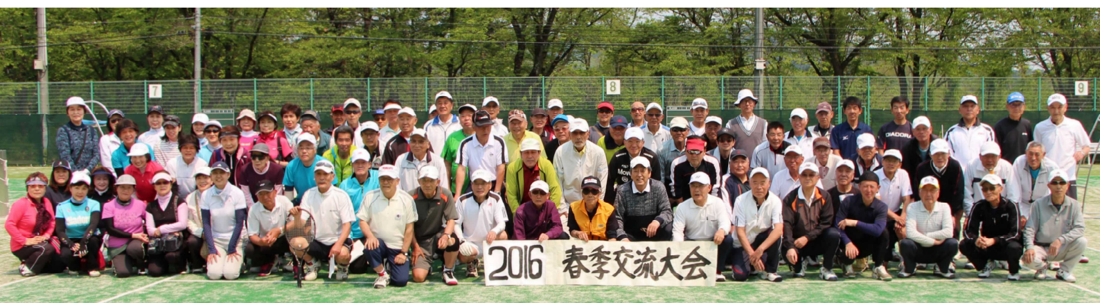
平成28年5月19日(木) 春季交流会(盛岡市太田テニスコート)