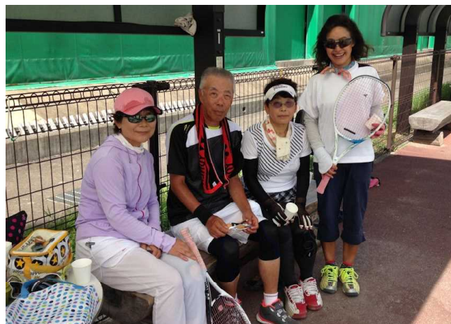
ロイヤル TC 会員のお嬢様方と。緩いボールでいじめられています。